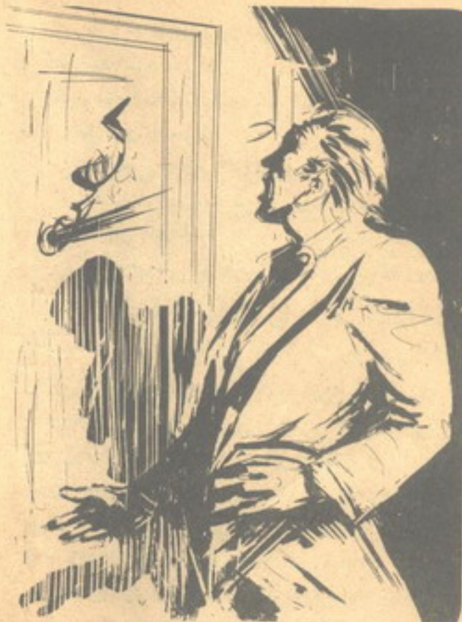
وتفجرت دماء الموت من رأس ( وجدى ) الضخم ، وهوى الرجل جثة هامدة ..

أغلق ( أدهم صبرى ) الباب ، واتجه نحو مكتب مدير الخبريات ، وجلس قبأته ، وهو يقول في اهتمام :